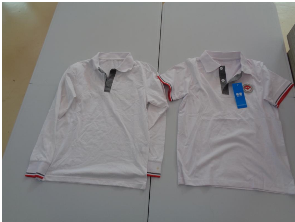
白色长/短袖 T 恤