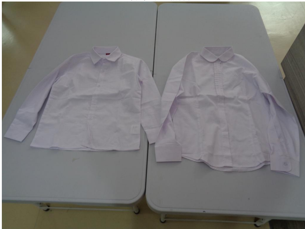
白色男/女款长袖衬衫